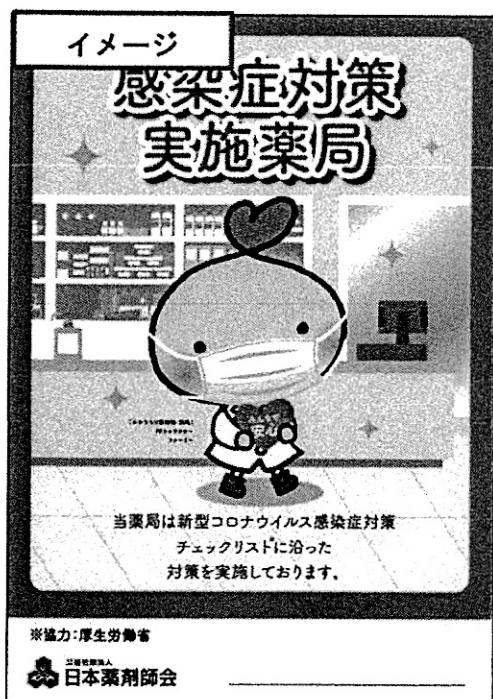
みんなで安心マーク

日本薬剤師会では、新型コロナウイルス感染が拡大している状況下でも、患者さんが安心して薬局に来局できるよう『新型コロナウイルス感染症等感染防止対策実施薬局 みんなで安心マーク』を作成し、感染防止対策を徹底し、チェックリストを満たした薬局に向け、発行できるよう準備を進めています。詳細は9月上旬～中旬にも本会のホームページにて、ご案内する予定です。